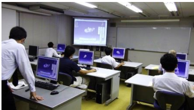
デジタルエンジニアリング研修